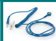
グラウンドコード