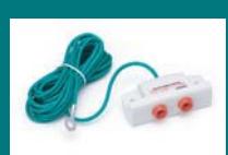
グラウンドタップ